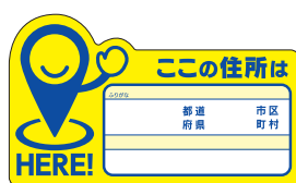
住所表示ステッカー